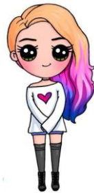
Tiene ojos marrones / oscuros.