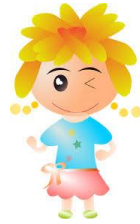
Tiene ojos oscuros