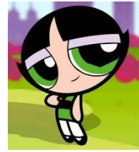
Tiene ojos verdes