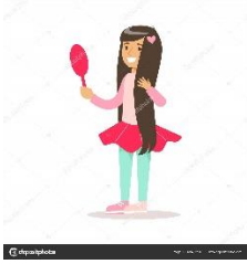
TIENE ojos claros