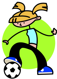
jugar a la pelota